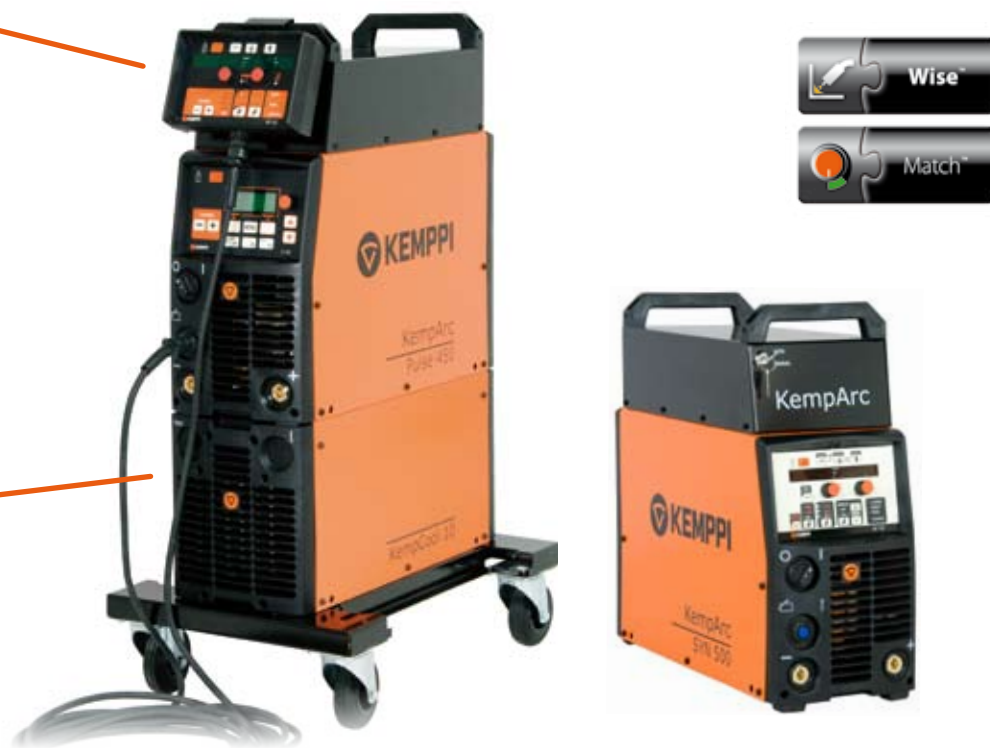
KempArc™ Pulse 450

Система KempArc разработана для автоматизации сварки MIG/MAG. Варианты процессов синергетической или импульсной сварки предлагаются в моделях с силой тока 300/400/500 ампер для синергетической сварки или в моделях для импульсной сварки с силой тока 350 или 450 ампер. Каждая серия предлагает логическую регулировку параметров процесса, обеспечивая быструю настройку в условиях интенсивной промышленной сварки. Технологические программные продукты для автоматизации сварки серии Wise предлагают дополнительные варианты решений.